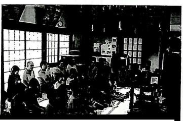
子ども道場は延期になりました。